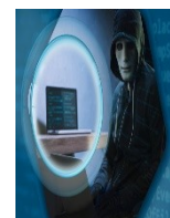
To zdjęcie, autor: Nieznany autor, licencja: CC BY-NC- ND